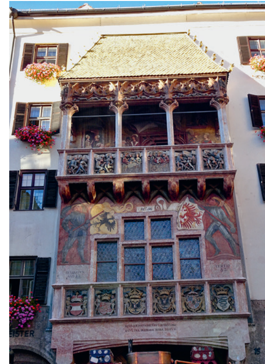
Das goldene Dachl in Innsbruck.

Und natürlich genossen wir auch die gute Gesellschaft untereinander, liessen alte Freund-