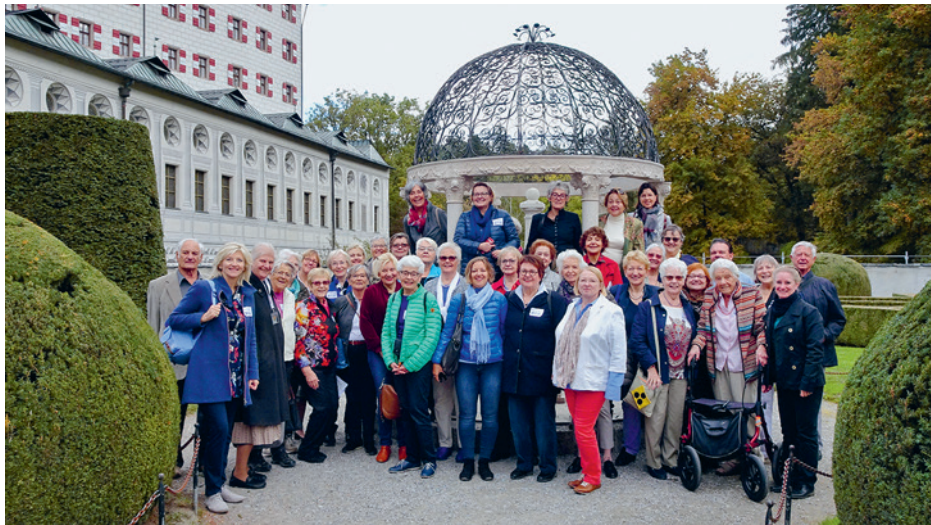
Teilnehmerinnen des DACH-Treffens vor dem Schloss Ambras.

Zentrum von Innsbruck erahnen. Uns beeindruckte aber auch das Geschick, mit dem die Habsburger ihre Herrschaft festigten und ausdehnten, vor allem durch kluge Heiratspolitik. Nicht nur die Männergeschichte interessierte, sondern auch die Ausstellung «Drei grosse Frauen aus dem Hause Habsburg» im Schloss Ambras. Erzherzogin Margarete, Statthalterin der burgundischen Niederlande, Königin Maria von Ungarn und Erzherzogin Katharina, Königin von Portugal, setzten Massstäbe für die fürstliche Kultur innerhalb der Dynastie der Habsburger.