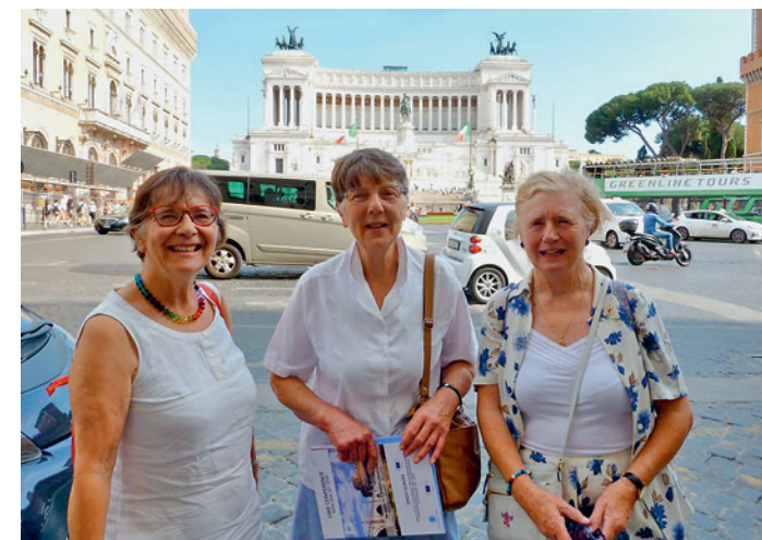
UWE-Tagung in Rom.

La conférence annuelle des University Women of Europe (UWE) s'est tenue à Rome, en juin. Le thème en était «Les femmes dans les