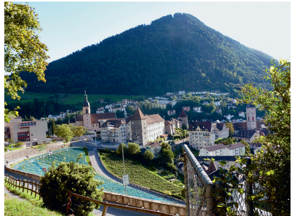
Blick auf Kantonsschule, Kathedrale, Hof- und Martinskirche.

Inscription par courriel (voir infolettre)