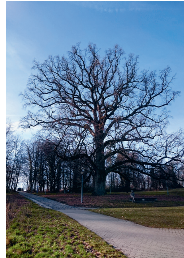
Symbole de l'UNIL, le chêne de Napoléon fait l'objet d'une étude de son génome: www.napoleome.ch .

L'ASFDU a organisé plusieurs rencontres en 2018: Assemblée générale à Soleure, journées de formation continue à Berne, sortie amicale aux archives Gosteli, à Worblaufen, etc. ... Quelques Vaudoises y ont participé.