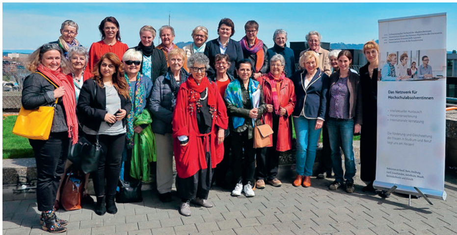
Teilnehmerinnen der SVA-Weiterbildung «Frauenflüchtlinge».

Verfolgung. Der Frauenanteil bei den in die Schweiz Geflüchteten beträgt 30–40%. Die meisten der geflüchteten Frauen sind mit geschlechtsspezifischer Gewalt konfrontiert. Sie ist zum einen Grund für ihre Flucht, zum anderen aber auch Teil ihrer Fluchterfahrung: Sowohl auf den Fluchtrouten als auch in den Zufluchtsländern sind viele Frauen Gewalt ausgesetzt. Die Prävalenz von Gewalt im Zufluchtsland Schweiz erhöht sich mit der Ausichtslosigkeit und der räumlichen Marginalisierung als asylsuchende Person und wegen des langen Wartens auf einen Asylbescheid. Zudem determiniert das soziale Geschlecht «Frau» die Bedingungen, wie Flucht und Aufnahme ins Asylsystem verlaufen, wesentlich: Spezifische Rechte und Bedürfnisse von asylsuchenden Frauen gelangen immer noch viel zu wenig ins Blickfeld.