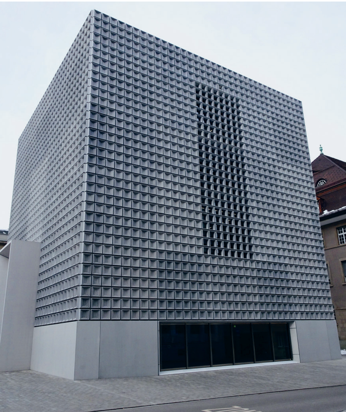
Erweiterungsbau des Bündner Kunstmuseums Chur (Estudio Barozzi Veiga, Barcelona 2016).