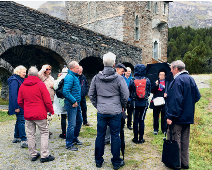
Ausflug ins Bergell.

Cette année un grand défi nous a été lancé par le comité des GWI, organisation faitière de l'ASFDU. Il s'agit de planifier la rencontre triennale et les célébrations du centenaire, en juillet, à Genève. Le Local Arrangements Committee (LAC) a organisé six séances, des rencontres avec le comité des GWI, l'Université de Genève (UNIGE), point de ralliement, et l'office du tourisme. Une croisière sur le Lac Léman, avec dîner de gala et musique (Swiss Evening) a été