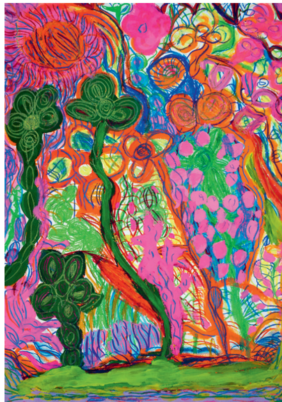
Emilie Frosio, © creahm.ch