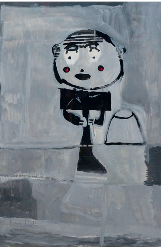
Iason Scyboz, © creahm.ch

Une année riche en rencontres se termine pour la section de Fribourg. En effet, six conférences ont été organisées lors des mercredis volants sous l'intitulé «hors des sentiers battus». Nous avons eu le plaisir d'accueillir Mi-